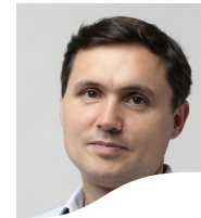
Pr Cedric Schweitzer Bordeaux, France