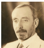
Pr Robert Debré

La réforme de la médecine initiée par le Pr Robert Debré se concrétise par l'ordonnance du 30 décembre 1958, avec la mise en place des CHU (Centres hospitaliers universitaires) formalisant les liens entre les établissements hospitaliers et l'Université autour de :