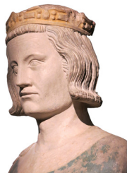
Statue de Louis IX début du XIV ème siècle.

La maison des aveugles de Paris fondée par Louis IX plus connu sous le nom de Saint Louis, est située, à l'origine, dans un espace s'étendant de l'actuelle place du Palais royal jusqu'au milieu du jardin des Tuileries et de la rue Saint-Honoré, à l'angle de la rue Saint-Nicaise.