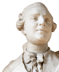
Buste de Louis XVI fin du XVIII ème siècle

Ces bâtiments construits entre 1699 et 1704 par Robert de Cotte (340 chambres, 14 antichambres et une salle de billard) accueillait la deuxième compagnie de mousquetaires noirs dont le surnom provenait de la couleur de leurs chevaux afin de les distinguer de la première compagnie (mousquetaires gris) jusqu'à la suppression de cette compagnie en 1775 par Louis XVI.