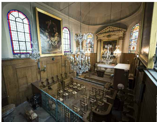
Chapelle Saint Rémi, inscrite à l'inventaire des monuments historiques (ancienne chapelle de la caserne des mousquetaires noirs).

Un ministre du culte de votre choix peut, si vous en exprimer le souhait, vous rendre visite. Merci d'exprimer votre demande auprès du cadre de santé.